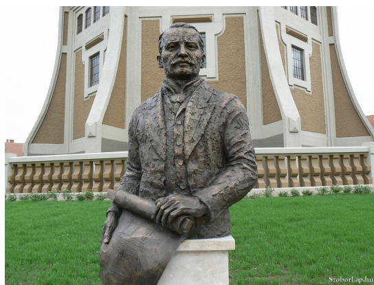
Zielinski Szilárd mellszobra 8