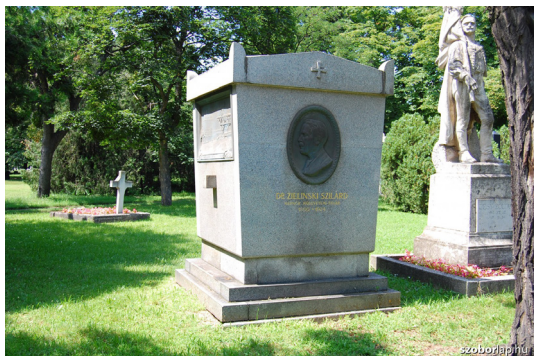
Zielinski Szilárd síremléke a Fiumei úti temetőben 10